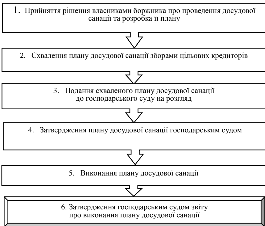
Рис. 2. Процес досудової санації підприємства

• Економія часу для більш оперативної і повної реалізації оздоровчих процедур щодо боржника завдяки мінімізації відносин із господарським судом, у більшості випадків відсутності потреби в зовнішньому арбітражному керуючому. Перед прийняттям рішення про введення процедури санації у рамках відкриття провадження у справі про банкрутство боржника повинні пройти такі обов'язкові стадії, як ініціація банкрутства боржника, ухвала про прийняття заяви до розгляду, підготовче, попереднє та заключне засідання суду, на якому за умови консенсусу й буде прийнято рішення про відкриття саме санаційної процедури.