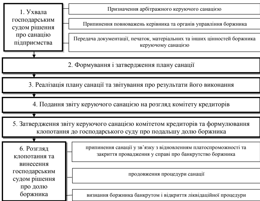
Рис. 1. Етапи здійснення санаційної процедури у рамках провадження справи про банкрутство

Досудова санація, або, як вказано у нормативних документах [1], санація боржника, до відкриття провадження у справі про банкрутство апріорі є ефективним інструментом вирішення неплатоспроможності й недопущення припинення підприємства без застосування витратного та тривалого судового розгляду за відкритим провадженням у справі про банкрутство. Схематично процес досудової санації подано на рис. 2.